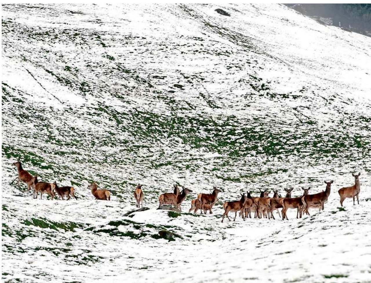
Rudel im Wintereinstandsgebiet: Hirsche wandern im November und Dezember von den Nachbarländern nach Graubünden ein. Bild Archiv

Quelle: Amt für Jagd und Fischerei Graubünden. Grafik: Südostschweiz